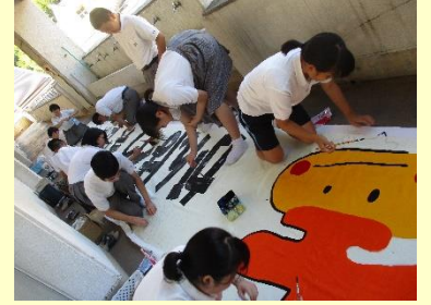
発展的な課題の解決