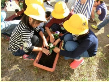
自己の振り返りの共有