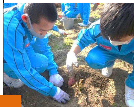
1年生じゃがいも収穫！