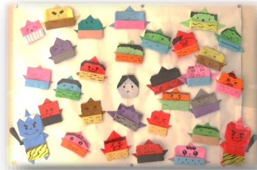
節分の鬼づくり(折り紙) 総合文化部 入部体験 小学六年生の作品