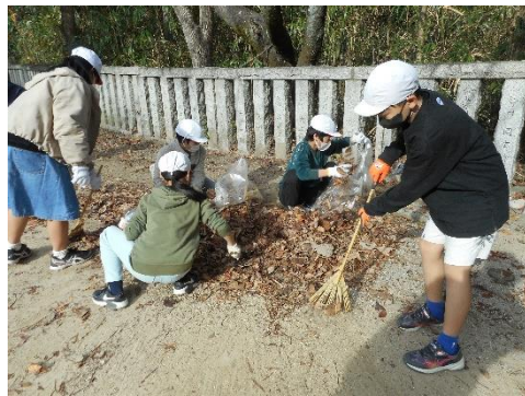
落ち葉を集めて、集めて・・・