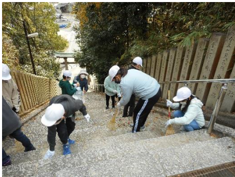
きれいになってうれしいね！！