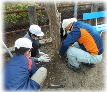
地域の方々と一緒に・・・

十二月七日(水)、広地区クリーン活動を行いました。この行事は、日頃お世話になっている地域をきれいにし、自分たちが住んでいる地域に対して、より愛着をもち、大切にしようと思う気持ちを育てるために行われています。 今年度は、小学五年生と中学一年生がそれぞれの場所に分かれ、地域の方々と清掃しました。子供たちは寒さも忘れて一生懸命に取り組むことができました。