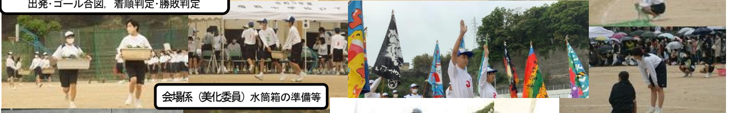
会場係(美化委員)水筒箱の準備等