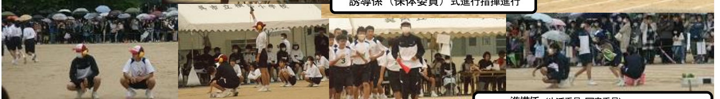
準備係(生活委員・図書委員) アンカーベスト・バトン配付, 用具の出し入れ