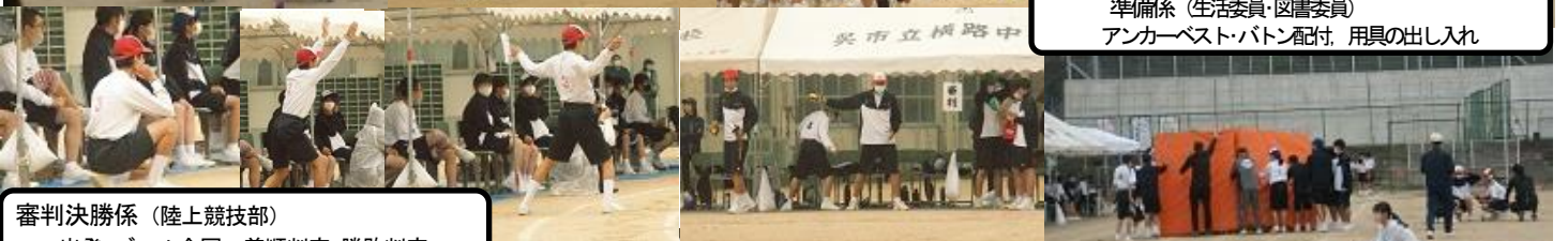
審判決勝係(陸上競技部) 出発・ゴール合図, 着順判定・勝敗判定