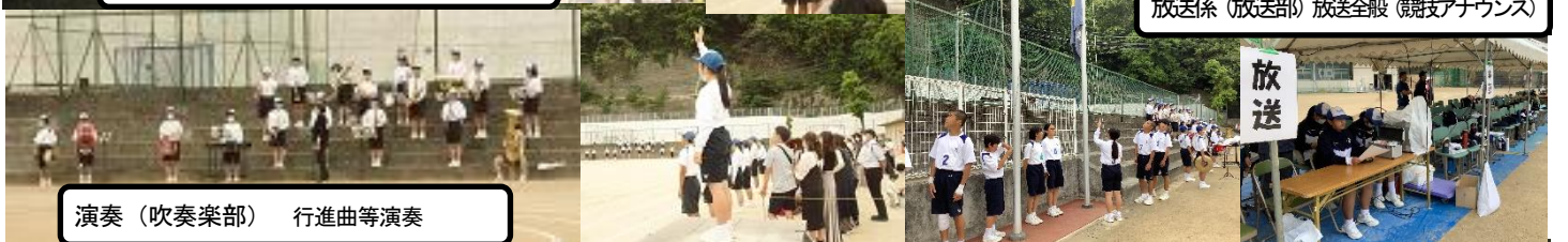
放送係(放送部)放送全般(競技アナウンス)