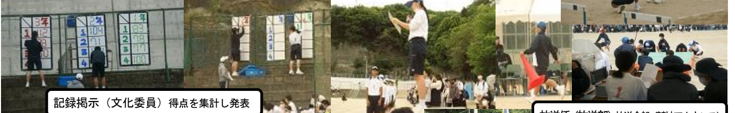
記録掲示(文化委員)得点を集計し発表