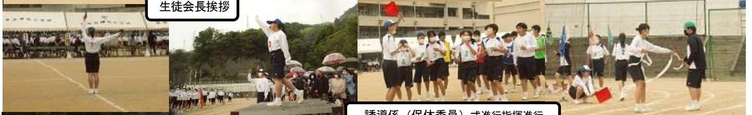
誘導係(保体委員)式進行指揮進行