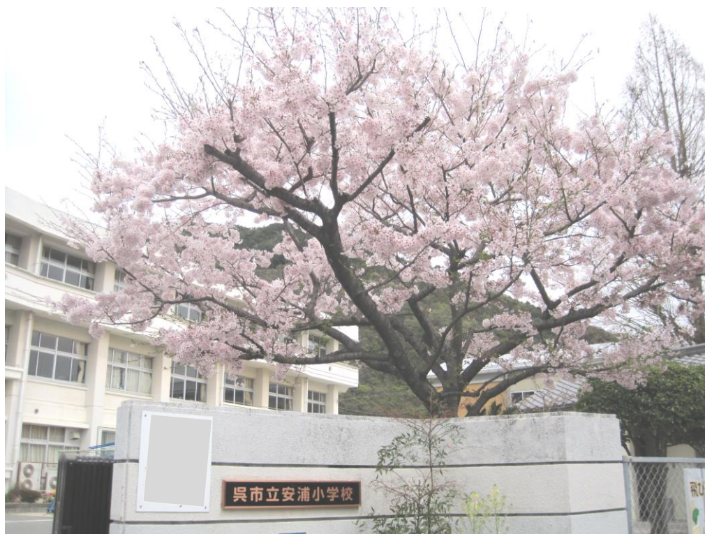
呉市立安浦小学校

ふるさとを愛し、よりよい未来の創り手となる児童の育成 ～ 学ぶ つながる 役に立つ ～