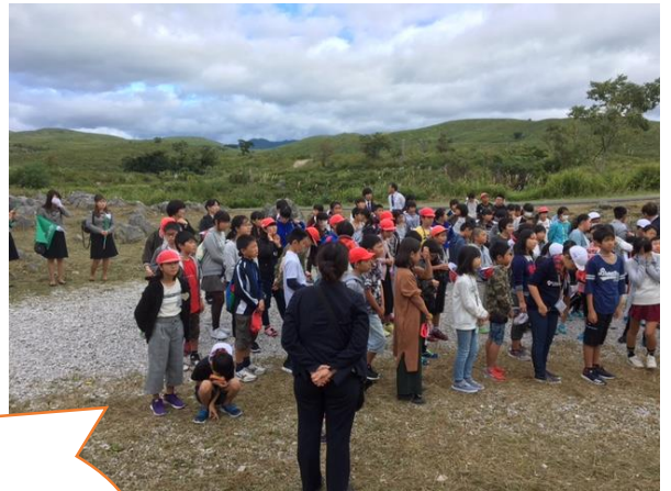
秋吉台で集合写真を撮ります。