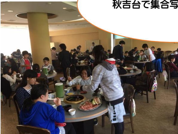
たくさん食べるぞ！