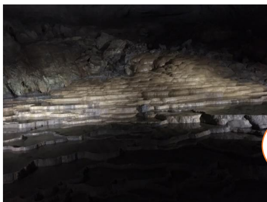
秋芳洞に行きました。