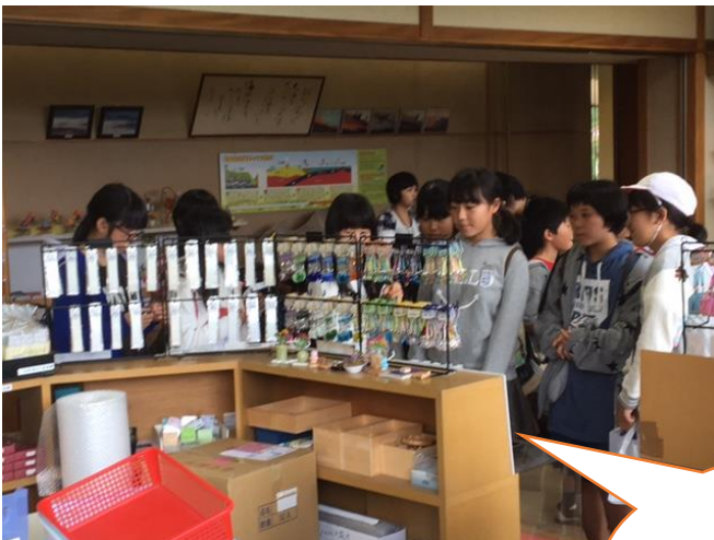
買い忘れはないかな。