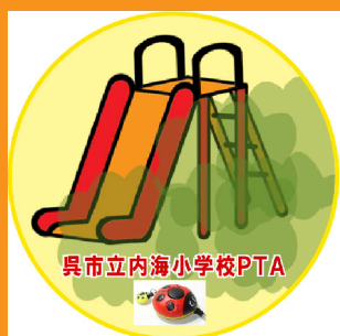
みとお わる こうえん 見通しの悪い公園