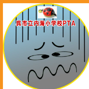
ひどけ すく ところ 人気が少ない所