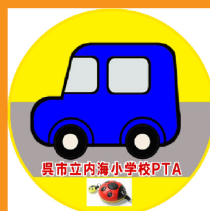
るじょう ちゅうしゃ 路上駐車