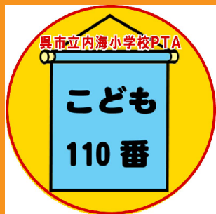
ばん いえ 子ども110番の家