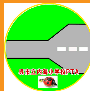
ほそ みち 細い道