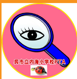
み ところ 見えにくい所