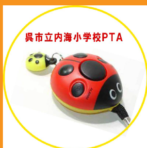
き ところ 気をつける所