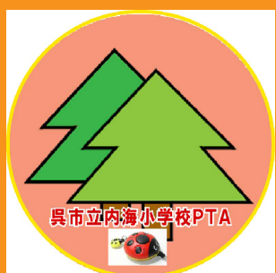
き かきね たか 木 垣根が高い