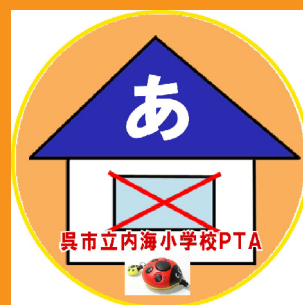
あき や 空家