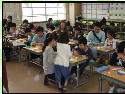
図画工作科「ひらめきコーナー」