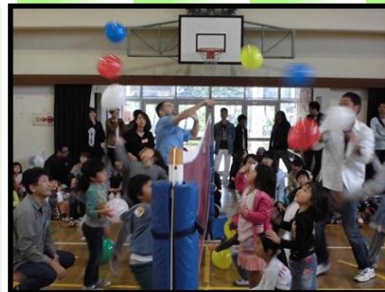
ふれあい活動「ふうせんバレー」