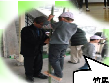
竹馬・缶ぼっくり

地域の方々に来て頂き、おかしあそびを教えてくださいました。子どもたちはあそび方のコツをたくさん教えてもらい、はじめてのあそびもどんどんできるようになりました。地域の方々とのかわりあいの中で、喜びや自信をたくさん感じることができた1日でした。