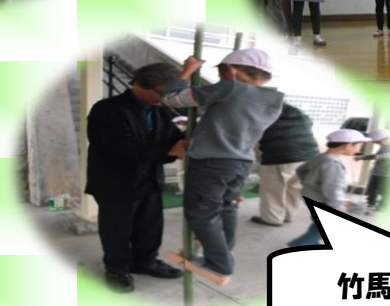
竹馬・缶ぼっくり

地域の方々に来て頂き、おかしあそびを教えて頂きました。子どもたちはあそび方のコツをたくさん教えてもらい、はじめてのあそびもどんどんできるようになりました。地域の方々とのかかわりあいの中で、喜びや自信をたくさん感じる事ができた1日でした。