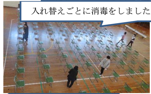
入れ替えごとに消毒をしました