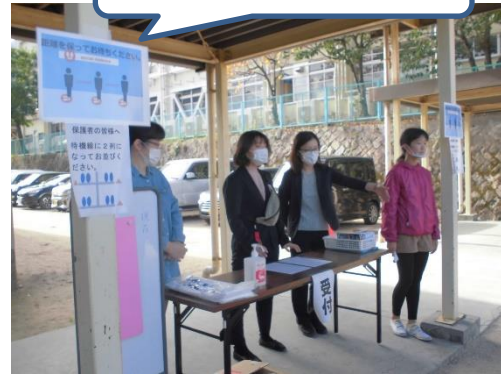
受付で検温をしました。