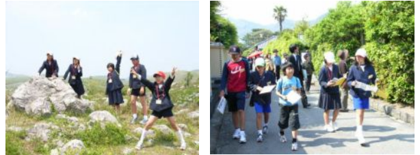
(秋吉台にて) (萩の城下町見学)

(竪穴式住居をバックに) また、旅館や公共交通機関でのマナーも良く、本当に心に残るよい修学旅行であったと思います。