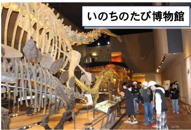
いのちのたび博物館