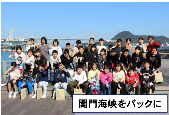
関門海峡をバックに