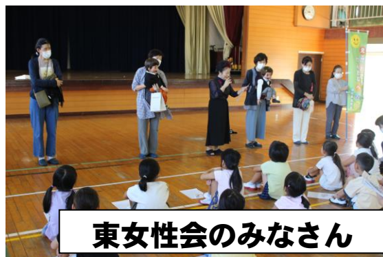
東女性会のみなさん

学校行事がコロナ前に戻り、地域の皆さんに学校に来ていただくことも増えました。いつも学校の教育や安全に対して、本当に温かなご協力をいただいています。これからも、地域や家庭とともにある南小をめざします。