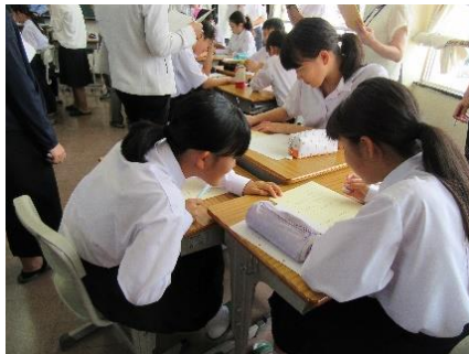
課題解決に向けたグループ討議 7年数学科