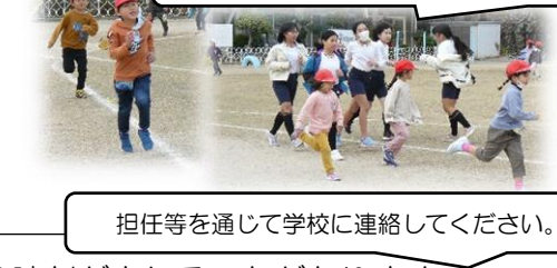
試走の後、大休憩に自主的に走る姿も！