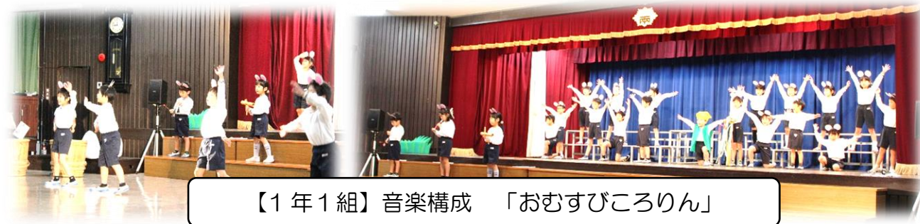
【1年1組】音楽構成 「おむすびころりん」