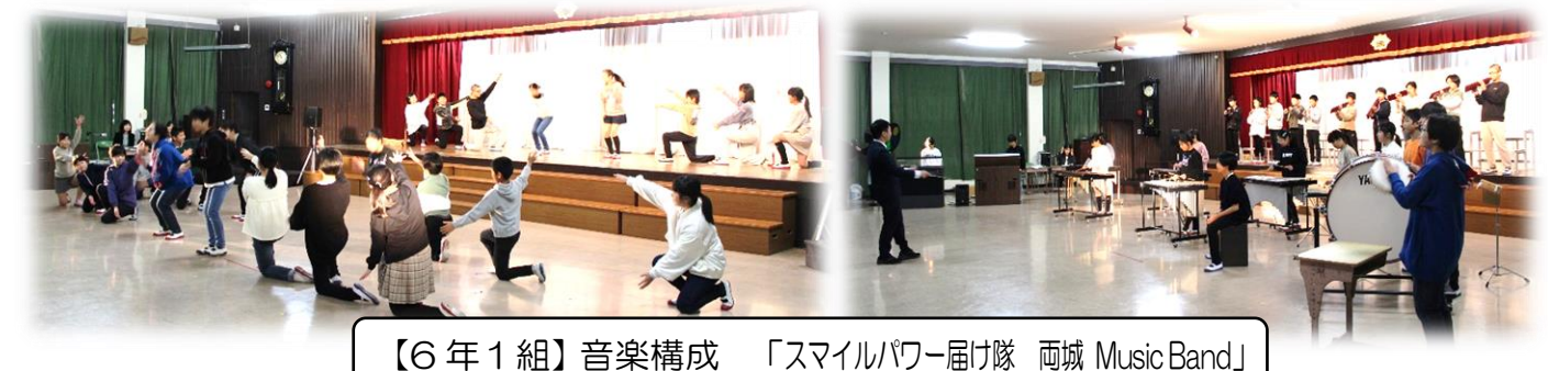
【6年1組】音楽構成 「スマイルパワー届け隊 両城 Music Band」