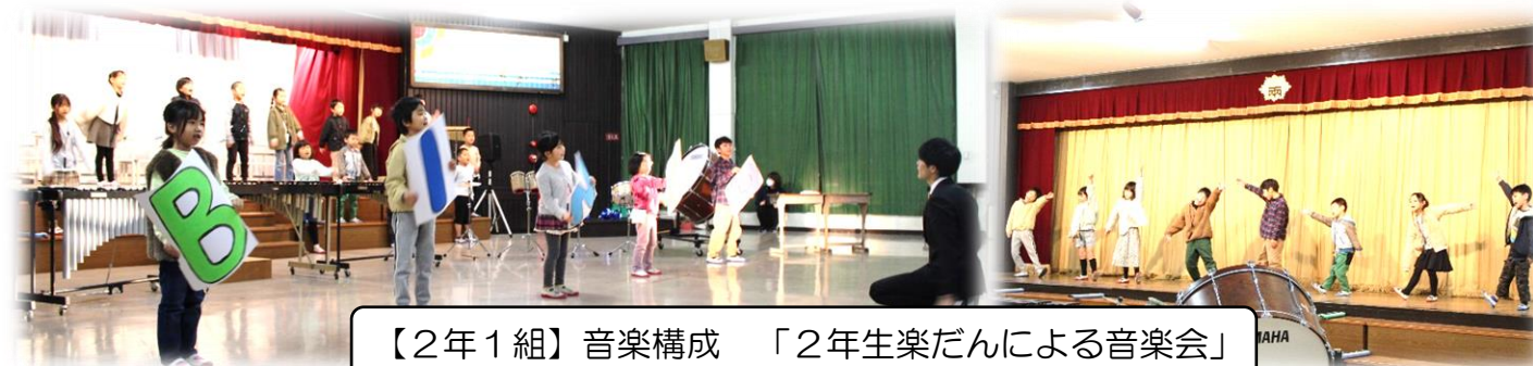
【2年1組】音楽構成 「2年生楽だんによる音楽会」

そして大勢の保護者や地域の方に見守られる中で迎えた本番では、これまでの中で最高の発表を届けることができました。発表を終え、がんばり切った気持ちの中、温かい拍手に包まれた子供たちは、大きな達成感と充実感を味わっていました。また、保護者の皆様、地域の皆様が見に来ていただいたことが、子供たちの励みとなり、気持ちを勢いづける最後の一押しになったと思います。子供たちを応援していただき、誠にありがとうございました。