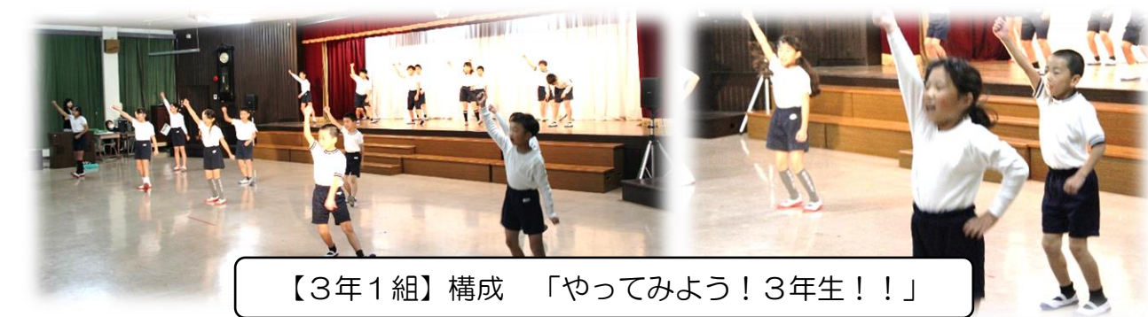
【3年1組】構成 「やってみよう！3年生！！」