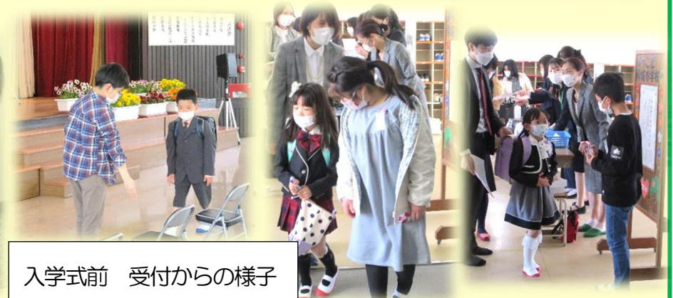
入学式前 受付からの様子

さて、繰り返すようですが、新型コロナウイルス感染症はまだまだ落ち着かず、「いつ」「どこで」「だれが」感染するか分からない状況です。本校でも感染が確認されましたが、学校では一層危機感をもって感染予防対策を行っていきます。子供たちには感染症対策に引き続き取り組むとともに、感染者がだれか等の詮索や憶測を控え、不確かな情報やSNS等で拡散することは絶対にしないように指導していきます。保護者の方も偏見なく接していただくようお願いします。