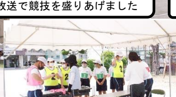
審判係(図書委員)みんなが楽しめるように公平に審判を行いました