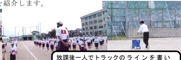
放課後一人でトラックのラインを書いていた保体委員長、閉会式では、表情に光るものが見えたような