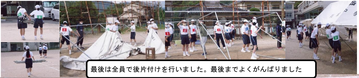
最後は全員で後片付けを行いました。最後までよくがんばりました