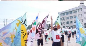
評議委員 旗手として選手宣誓を行い、クラスをまとめました