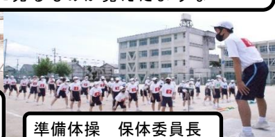
準備体操 保体委員長