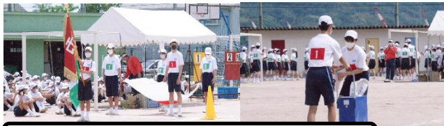
生徒会執行部 競技途中のライン引き等

5月14日(金)の午後、「電光雷轟～勢いに乗り勝利をつかめ！」というテーマのもと体育大会を実施しました。今年度どうしても体育大会を行いたい、生徒にクラスで団結し、よい思い出をつくってほしいという思いで、前日の夜になりましたが、予定を変更させていただきました。突然の変更にもかかわらず、ご理解とご協力をいただきありがとうございます。生徒たちの競技での活躍はGoogle Classroomをご覧ください。ここでは係りののんびりを紹介します。