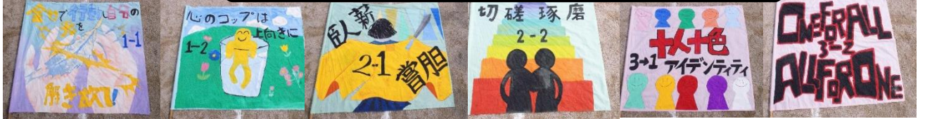
学級旗デザイン 1-1 石田 1-2 山下 2-1 天野 2-2 久保 3-1 高岡 3-2 寺口