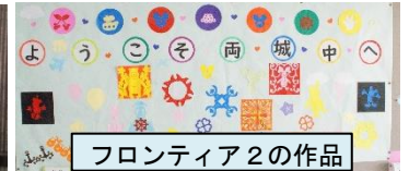
フロンティア2の作品