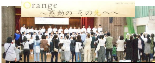
3年生は全員で卒業アルバムの写真を撮りました

展示は、校内で11月7日(月)まで公開しています。(11月1日～11月7日は『学校へ行こう週間』)ここでは、展示のほんの一部を紹介します。ぜひ学校に来てご覧ください。時間は9時00分～13時30分、場所は第1校舎1階です。