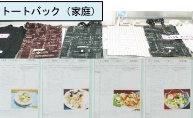
トートバック(家庭)