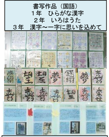
2年キリ新聞(総合的な学習の時間)