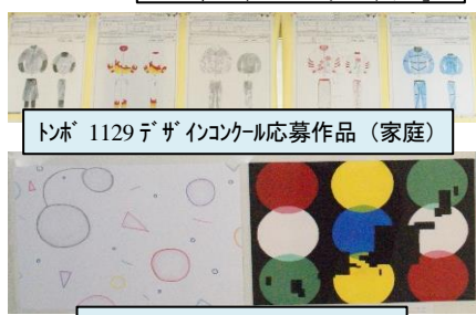
トボ 1129デザインコンクール応募作品(家庭)