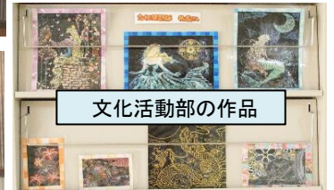
文化活動部の作品