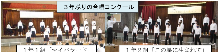
3年ぶりの合唱コンクール