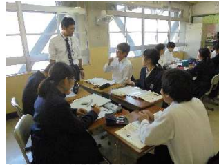
なりすまし投稿による誹謗中傷

・女子中学生が、コミュニティサイトで知り合った男性モデルになりすました男に、自分の裸の画像を送信させられた。