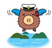
「くれ坊」 (生徒が考えたキャラクター)