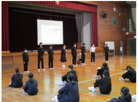
結団式の様子 (各連合のリーダーの挨拶)