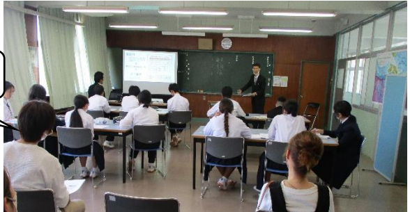
3年生の進路説明会の様子