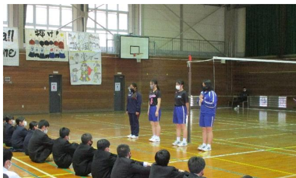
女子バレーボール部の紹介