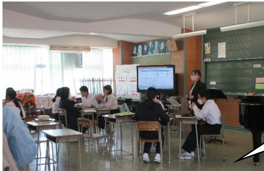
2年生の授業の様子