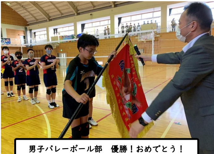
男子バレーボール部 優勝!おめでとう!