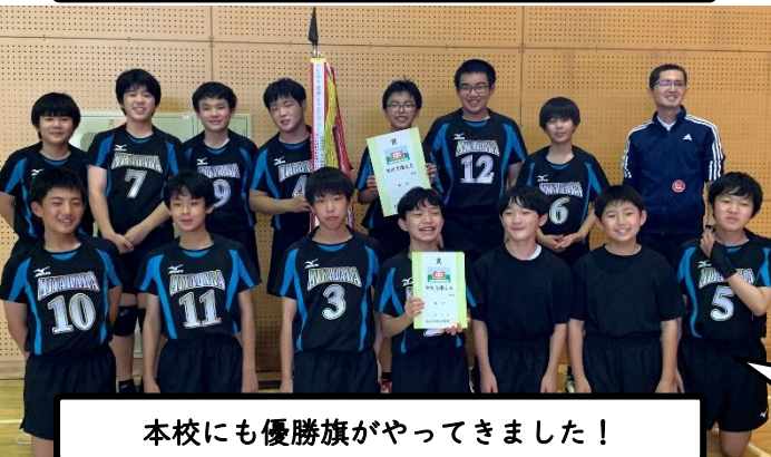
本校にも優勝旗がやってきました!

令和4年10月22日(土), 23日(日)に, 呉市中学校新人大会が行われ, 本校から新チームの1・2年生が参加しました。