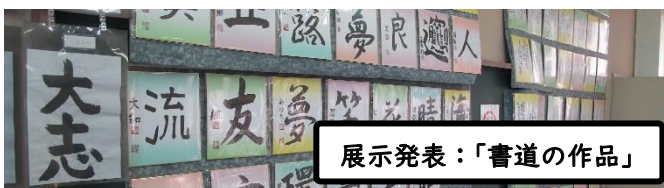
展示発表: 「書道の作品」