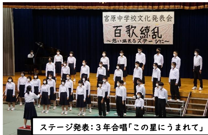
ステージ発表: 3年合唱「この星にうまれて」

生徒全員が一丸となって文化発表会を成功に導くことができたこの経験は、ぜひ、今後の生活に活かしてほしいものです。今年度の保護者の方は、自分のお子さんの発表時のみの見学でした。地域の方には、この「学校だより」で少しでも雰囲気を感じていただければ幸いです。