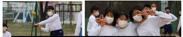
1年生は，柔らかボールでソフトボール！

1・2年生が学年末の思い出に，自分たちで企画したレクを楽しみました。コロナ禍での一時，みんな笑顔でしたね！