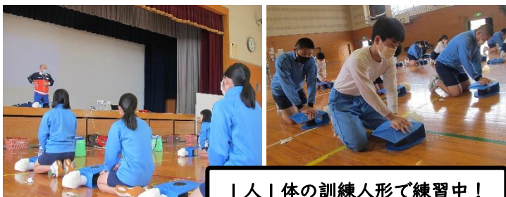
1人1体の訓練人形で練習中！

「もし，目の前で人が倒れたときに，中学生の君たちはどうするか？」をテーマに，事故発生時の初期対応（心肺蘇生法）の仕方やAEDの使い方など個別体験を交えながら学びました。講師の方は「いざという時，冷静に行動するためには，やるべき事を声に出し，指で示し，複数で対応するといいよ」とアドバイスを頂きました。