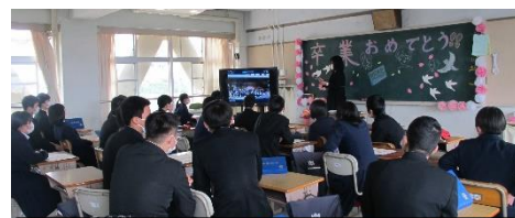
思い出ムービーを見入る卒業生