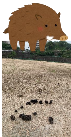
校庭に残されたイノシシの糞

猟友会の方からは、「遭遇したときは、くれぐれも大声を出してイノシシを刺激しないように」「イノシシを近づけないためには、イノシシに魅力のない地域づくりが大切」とアドバイスを頂きました。学校もイノシシの通り道などを塞いでいきます。校内だけでなく宮原地区にも多く出没するようです。地域の方も心配でしょう。イノシシさ〜ん、お願いですから山に帰って下さ〜い。