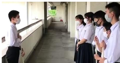
放送に合わせて黙想です。