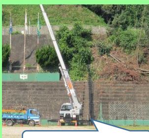
「クレーン車も出動」