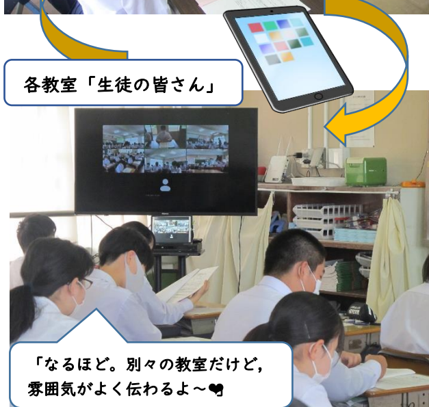
各教室「生徒の皆さん」

各教室のテレビモニターに生徒会執行部や各教室の生徒たちが映し出され、別々の場所に居るのに、お互いの顔が見え、意見交流ができる生徒総会となりました。宮原中生徒会の新たな挑戦ですね！