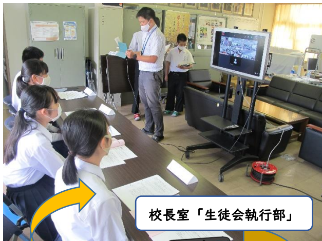
校長室「生徒会執行部」

令和3年6月2日(水)6校時、宮原中学校生徒総会をなんと！オンラインで行いました！