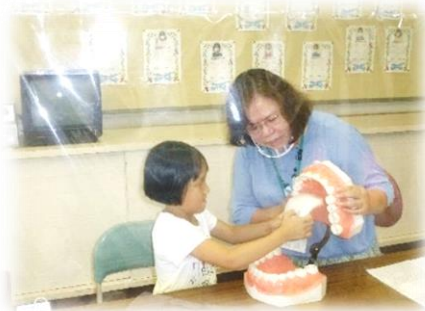
口の模型で舌のあたる位置を確認