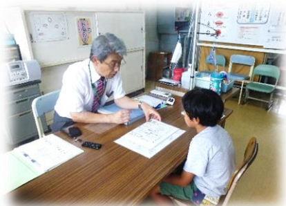
早口言葉や音読の練習

本校にある通級指導教室「ことばの教室」では、マンツーマンで子供の実態に合った指導を行っています。主に午前には本校の児童、午後には他校からも指導を受けに来られます。指導を受けた子供達は、個々の言葉の課題を克服しつつ、自信も付けていっています。