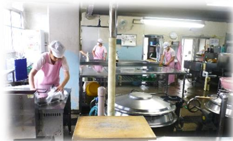
エアコンのない暑い中、給食を作り続けてくださった調理員さんに感謝