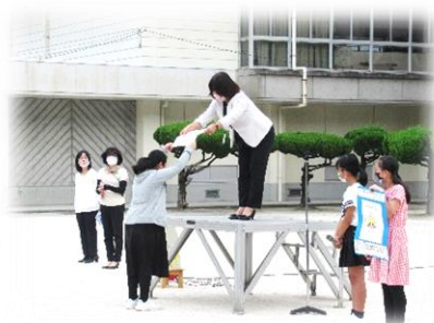
先日行われた「いじめ撲滅キャラクター総選挙」の表彰