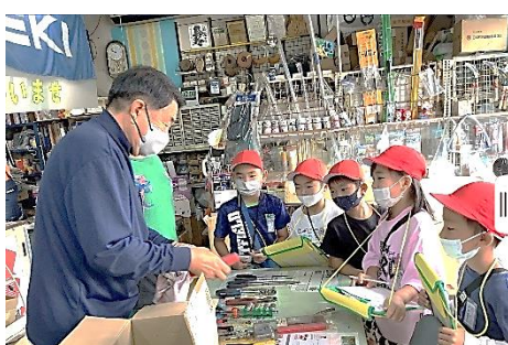
質問に優しく丁寧に答えてくださいました。