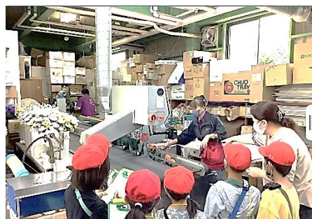
各場所のひみつもたくさん見付けました。