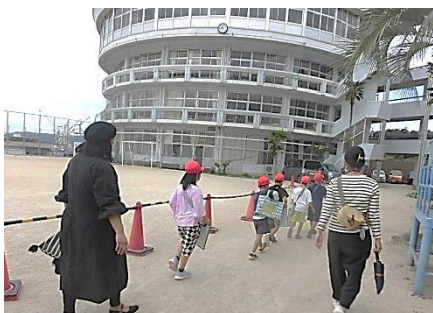
保護者の方に見守って頂きながら出発！

ご協力していただいた地域の皆様、保護者の皆様、ありがとうございました。おかげ様で実際に体験することができ、子どもたちの大きな成長を感じる学習となりました。