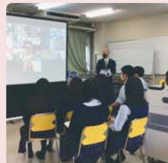
オリンピック高校とのオンライン交流会