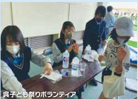
呉子ども祭りボランティア