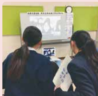
昌原市デアム高校とのオンライン交流会

呉市と姉妹都市提携を結んだ台湾の基隆市立安樂高級中學との交流のほか、様々な国際交流を行っています。