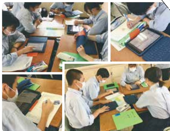
タブレットを用いた探究活動