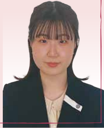
呉市役所 市民窓口課