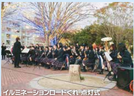
イルミネーションロードくれ点灯式