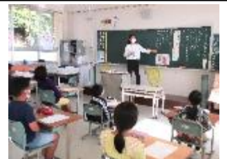
5年「その遊び方、だいじょうぶ?」

11月2日(火)には、感染症拡大の影響で9月から延期となっていた道徳授業参観と学級懇談会を行うことができました。保護者の皆様には、健康観察カードの提出、身体的距離の確保等の感染症対策にご協力いただき、ありがとうございました。先月の学習発表会に続いて、日頃のがんばりを保護者の方に見ていただくことは、子供たちの意欲につながり、一層張り切って授業に臨む姿が見られました。全学級で道徳科の授業を行い、読み物教材の登場人物の心情や判断について、自分の経験と関わらせて考えたり、役割演技を体験したりして、その後の話し合いで考えを深めていく様子を見ていただきました。授業の終わりには「友情」「自律」「家族愛」「自由と責任」等の主題について自分なりの考えをもち、日常化・行動化に向けた決意のことばを述べている子供たちも見られました。こうした学習を通して、実際に出合う様々な場面で、自ら考え、判断し、実行する力を付けていきたいと考えています。学級懇談会では、授業を通じた子供たちの成長や学校・家庭での様子について交流することができました。ご家庭でも授業についてお子さんと話し合う時間をもっといただけたらと思います。学校と家庭で、学んだことを実行している姿をしっかりと認め、褒めることで、心も体も健やかな子供たちを育てていきましょう。