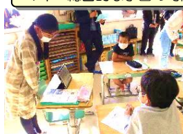
4年 総合的な学習の時間