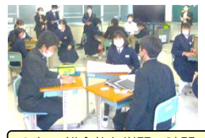
9年 総合的な学習の時間

子供たちの姿がとてもよかったです。この倉橋の地域を自分たちで盛り上げていこうとする主体的な姿でした。