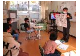
ひまわり1組「うめのき村の四兄弟」