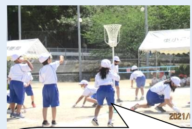
【ねらってねらって・1,2年】 初めての運動会。力を合わせて玉をたくさん入れました。