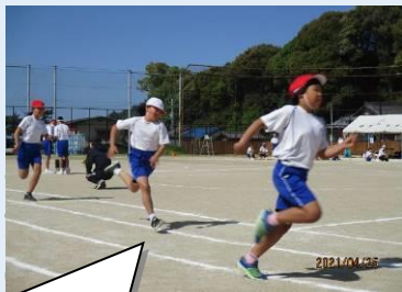
【徒競走・1～6年】 最後まで全力で走りぬきました。

さて、4月25日(日)は、晴天に恵まれ、晴れ渡った青空のもと、「令和3年度第8回倉橋学園運動会」が行われました。子供たちは今年のスローガン「ひとつ」を合言葉に、一人一人が全力で、みんなの力と心を「ひとつ」にしてやり切ることができました。感染防止対策上、様々な制約がありましたが、児童生徒・教職員みんなで工夫して、力を合わせてやりとげた特別な運動会になりました。最後まで力いっぱい駆け抜けた徒競走、バトンに気持ちを託してつないだリレー、異学年とかかわりつながり絆を深めた団体競技、小学校全学年の力を結集した表現(ダンス)等、3週間という短期間で取り組んだとは思えないものでした。そんな小学生のがんばりを優しく温かく見守り応援する中学生の姿も印象的でした。小学生も中学生の美しく力強い行進や迫力ある100m走、リレーに感動し憧れの気持ちをもつことができました。また、6年生は中学生と共に係の仕事も担当し、運動会がよりよいものになるように進んで働き、みんなのためにきびきびと動く態度が輝いていました。運動会という大きな行事を通して、子供たちが大きく成長し、主体性や協働する力、自己有用感が高まったことを実感しています。そして、この経験がこれからの学習や生活の中で生かされることを確信しています。