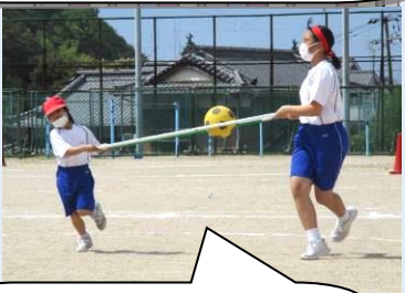
【ボール運び・1,2,9年】 ボールを落とさないように慎重に…