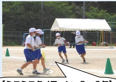
【ミニミニタイフーン・3～6年】 棒の両端を持って、コーンを旋回しながら走りました。