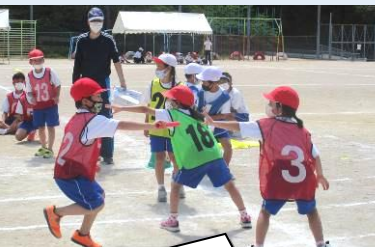
【小学校リレー・3～6年】 次の走者にバトンパス! 「まかせたよ。」