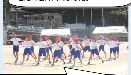
【表現/倉橋っ子が「夜に駆ける」・1～6年】 1～6年生みんなでリズムに乗っておどりました。練習の成果を出し切りました。