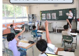
授業参観の風景より

さらに、生活朝会や縦割り班掃除等仲間のよさを認め合う場面も増えています。上学年の姿に学びながら静かに集合したり、黙々と担当場所を掃除したりする姿、そして、お手本となることができる高学年を頼もしく感じています。こうしたがんばりや成長をしっかりと振り返らせ、褒めることで、自信と意欲、自己有用感をもって1学期のゴールを迎えてほしいと思っています。