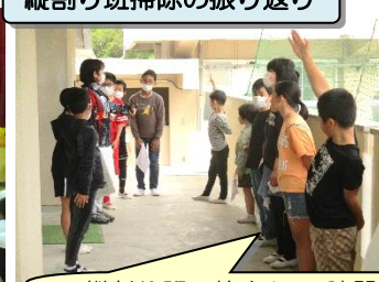
縦割り班掃除の振り返り