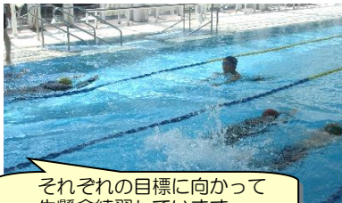
それぞれの目標に向かって一生懸命練習しています。