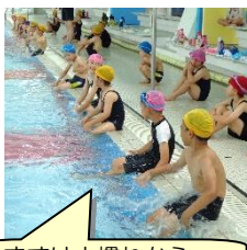
まずは水慣れから…

6月12日(月)から7月10日(月)まで、毎週月曜日に呉市くらはし温水プール「ウイングくらはし」で水泳の授業を行っています。きまりを守って安全に学習することができるよう、各学年で事前指導をしっかり行って開始しました。複数体制で見守り、個々の目標に応じて指導するために、本年度は3つの学年が一緒に授業を行っています。子供たちはそれぞれのコースで指示をよく聴き、安全に楽しく活動することができています。もぐったり浮いたり長く泳いだり…水に慣れ親しみ、水泳能力を高めようとがんばっています。ご家庭においては、水泳道具の準備をありがとうございます。引き続き、水泳実施日の健康観察カードのご記入や励ましの声かけ等、ご協力よろしくお願いたします。