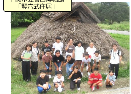
下関市立考古博物館 「竪穴式住居」