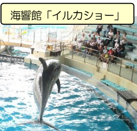
海響館「イルカショー」

そして、いつもお世話になっている6年生のために、「無事に帰って来てね。」の思いを込めてかわいいお守りを作ってくれた1年生。6年生がいない2日間、学校や登下校のリーダーとしての役割を立派に引き継いだ5年生。…行事を通して「かかわり つながり 学び続ける」倉橋っ子の姿に心が温かくなりました。