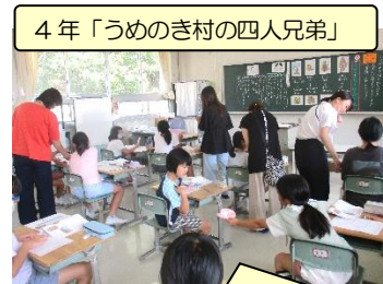
4年「うめのき村の四人兄弟」