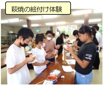
萩焼の絵付け体験