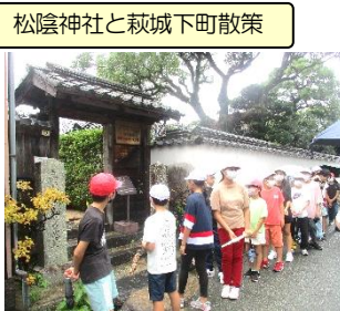
松陰神社と萩城下町散策