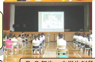
5,6年生・中学生対象

大雨が降ると土砂災害が起きてとても危険なことがよく分かりました。命を守るために「垂直避難」と「水平避難」があることを知りました。【5年生児童】