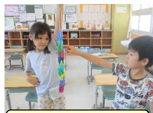
みんなの折り鶴をつまみました。【2年生】

8月6日は「広島平和記念日」。8月4日（金）の登校日には、各学級で平和学習を行いました。原子爆弾が広島をの街を一瞬にして破壊し、多くの方の尊い命を奪ったこと、今なお放射線の影響で病気を抱え不安な生活をしている方がおられることなどを改めて学びました。広島平和記念資料館による学習資料、絵本の読み聞かせや動画から真剣に学び、現在の世界情勢と重ね合わせながら世界平和のために自分にできることを考える姿も見られました。心を込めて折り鶴をつくる学年もありました。戦争の悲惨さを通して、核兵器廃絶や平和への願いを強くもつことができました。