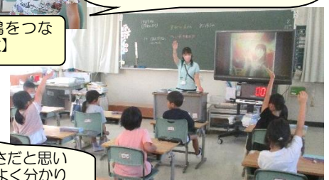
読み聞かせから考えたことを発表しています。【1年生】

違いを認め合い相手を受け入れることが本当の強さだと思います。広島の人々はつらく苦しい思いをしたことがよく分かりました。原爆のことをいろんな国の人に知ってもらいたいし自分にできることを考えていきたいです。【6年生児童の振り返りより】