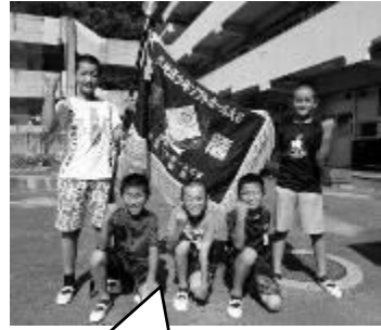
優勝旗を囲む選手たち

呉市民広場で行われた大会を制した明德レッドブリッジ。九月二二日に優勝旗が本校にやって来ました。低学年の子供たちは「すごい！」と優勝旗を眺めていました。次は今月一〇日・十一日に呉市民広場で開催される県大会です。がんばってください。