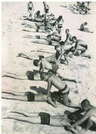
昭和40年頃桂浜にて