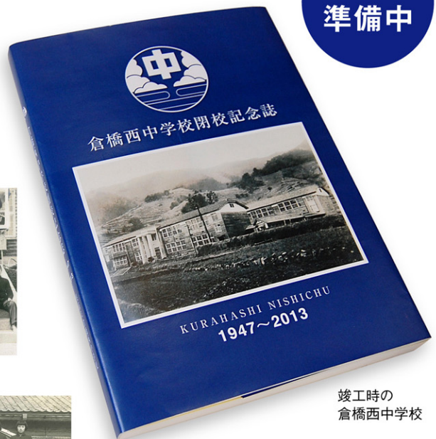
竣工時の 倉橋西中学校