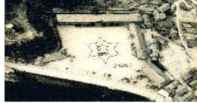
旧室尾小学校（現在位置）

平成17年3月20日に呉市との合併により、「呉市立倉橋東小学校」となった。平成25年3月に閉校となる予定である。 旧大迫小学校