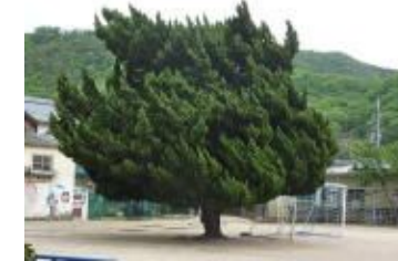
子ども達を見守る かいつかいは

縦割りで掃除をしたり、集団活動を行ったりして、人に対する思いやりや協力することの大切さを学びます。