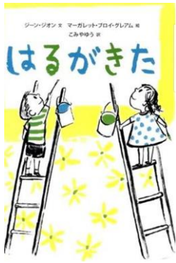
1・2年生向け 『はるがきた』 ジーン・ジオン文

コロナ禍でつい暗い気持ちになってしまいがちですが、この本の男の子のように、春が来ないと下を向くのではなく僕たちで春にしよう！という前向きな気持ちを自分も見習いたいな、そんな風に感じさせてくれる一冊です。