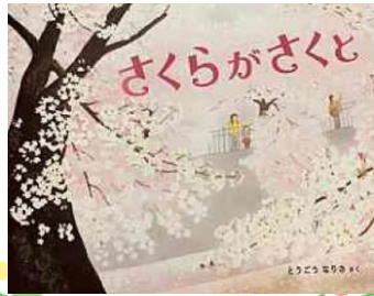
3・4年生向け 『さくらがさくと』 とうごう なりさ作

コロナ禍でつい暗い気持ちになってしまいがちですが、この本の男の子のように、春が来ないと下を向くのではなく僕たちで春にしよう！という前向きな気持ちを自分も見習いたいな、そんな風に感じさせてくれる一冊です。