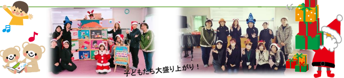
子どもたち大盛り上がり！