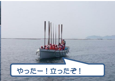
やったー！立ったぞ！