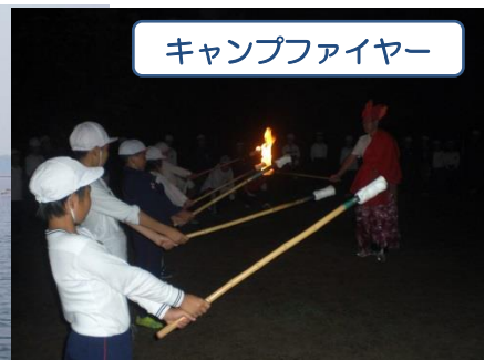
キャンプファイヤー