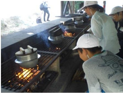
野外炊飯 すき焼き丼づくり

5年生は、7月27日(木)～29日(土)に2泊3日の野外活動を江田島青少年交流の家で行いました。“気づき、考え、実行する「GO!5!ステップバイステップ野外活動」～友情・責任・健康・自主・協力～”を全体のめあてとし、その実現に向けて班や係、自分のめあてを決めて活動しました。