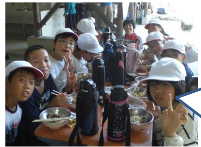
みんなで作ったから おいしいね。