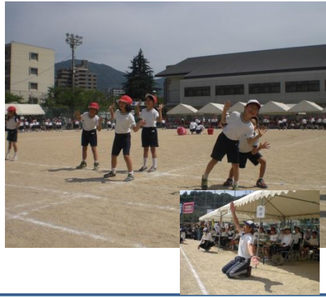
はなまる 玉入れ にっこにこ（1・2年生） かわいい恋ダンスのあとは、奇跡の玉入れ！まさかの2回戦とも同点引き分け！！