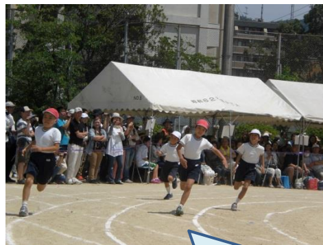
カーブを曲がってかけぬけよう 90m走（3年生） コースに沿って、カーブもうまく曲が って、全速力で走ります