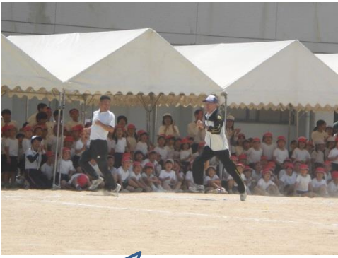
部活対抗リレー（教職員参加） 先生だってがんばります！