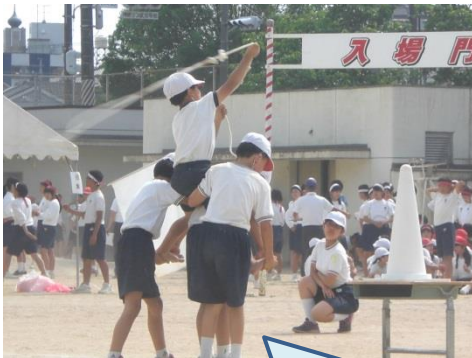
GO！5！カウボーイ・カウガール （5年生） ねらいを定めてえいっ！ 支える人と息を合わせて倒します