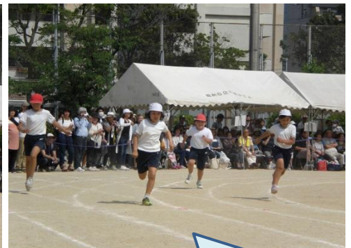
全速力でかけぬけよう 100m走（4年生） 3年生よりさらに10m長く走り ます。カーブもお任せ！