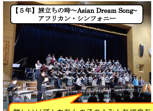
【5年】旅立ちの時~Asian Dream Song~ アフリカン・シンフォニー