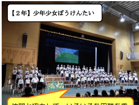
【2年】少年少女ぼうけんたい