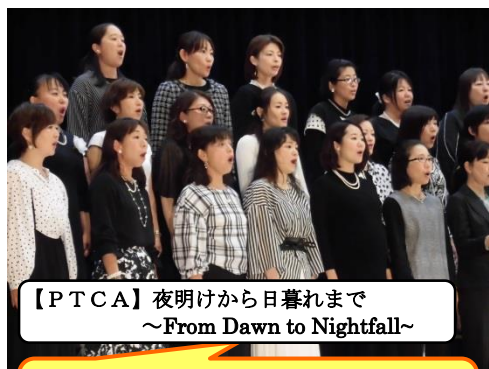
【PTCA】夜明けから日暮れまで ~From Dawn to Nightfall~