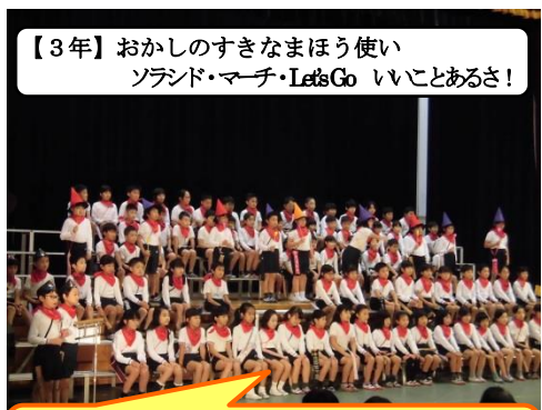
【3年】おかしなすきなまほう使い ソランド・マーチ・Let's Go いいことあるさ!