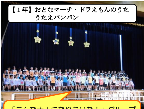
【1年】おとなマーチ・ドラえもののうた うたえバンバン

早朝より、たくさんの保護者や地域の方に来ていただき、子供達の応援をしていただきありがとうございました。また寒い中、学習発表会の運営にご協力いただいたPTCAの役員の皆様、ありがとうございました。