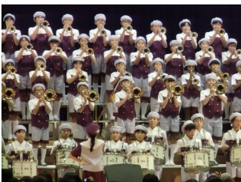
【6年】トランペット鼓隊・カントリーロード ふるさと

宝物コンクールに優勝したのは、お年寄りと働く人と子供!4年生の名演技にくすりと笑ってしまいました。