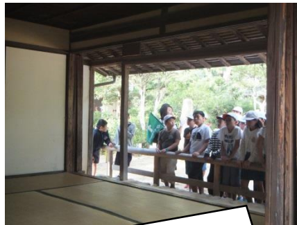
松下村塾や竪穴式住居で、昔の人の暮らしぶりを想像しました