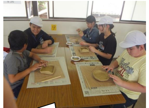
世界にたった一つの萩焼を作ります