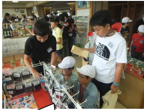
おみやげ選びも真剣です