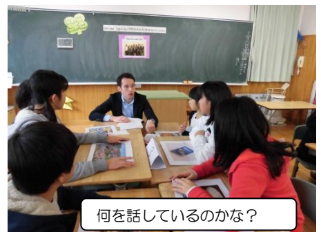
何を話しているのかな？