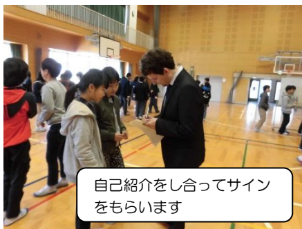
自己紹介を合せてサイン をもらいます