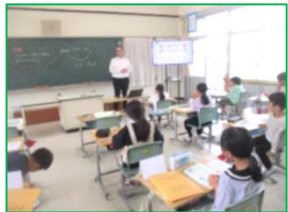
【3年生】外国語活動 「ジェスチャーを使って自分の様子を伝えよう」