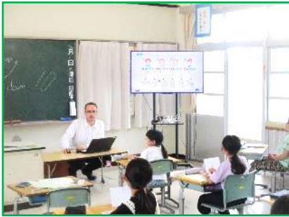
【4年生】外国語活動 「ジェスチャーを使って自分の様子を伝えよう」