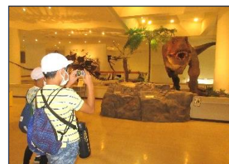
愛媛県総合科学館