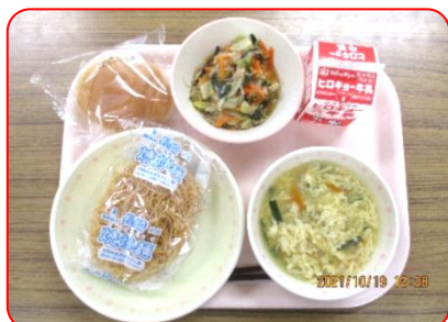
ロールパン、揚げそばあんかけ、ニラ玉スープ