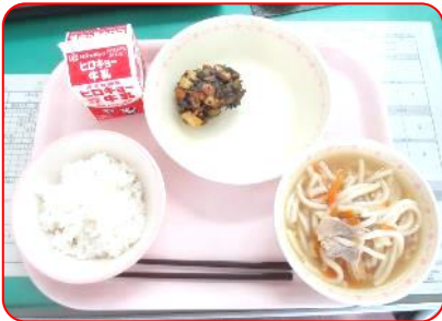
五目うどん, 岩石揚げ