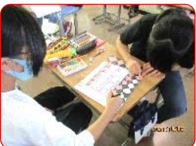
国語科:注文の多い料理店