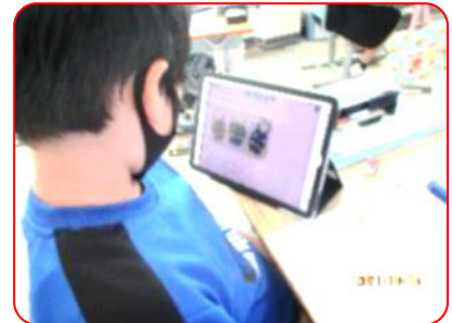
総合:警固屋のやぶについて