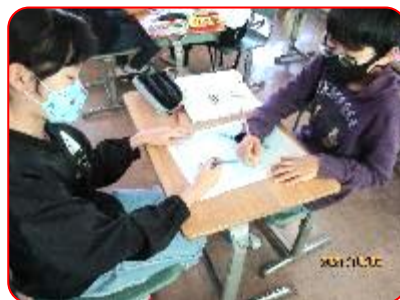
国語科:注文の多い料理店