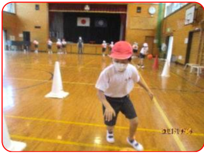
3年生体育科:ポートボール(ドリブル練習)