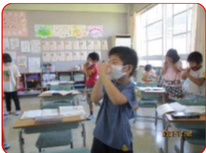
国語科: ゾウさんは、こんな感じかな。