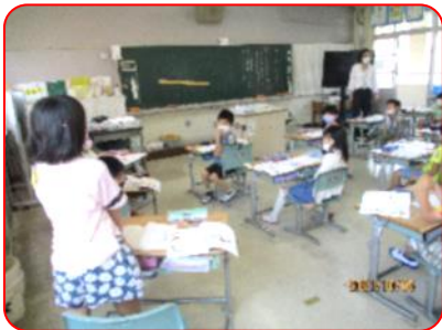
国語科: サラダげんき