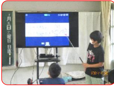
算数科:比の学習(解き方の説明)