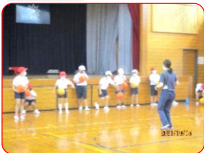
3年生体育科: ポートボール(ドリブル練習)