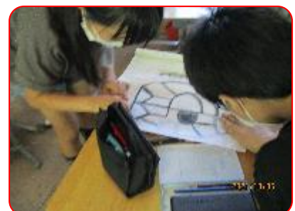
国語科:注文の多い料理店