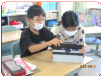
国語科: 描いた絵を見て意見交流。