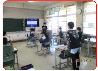
算数科:比の学習(質問しています。)