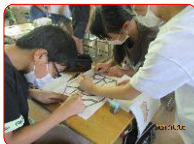
国語科:注文の多い料理店