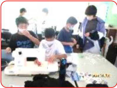
家庭科:エプロン作り(ミシン)