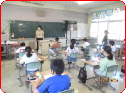
算数科:昨日の復習