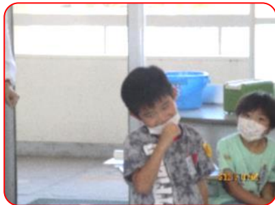
国語科: 少し恥ずかしそうにしています。