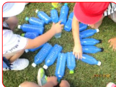
図工科: ペットボトルで模様づくり