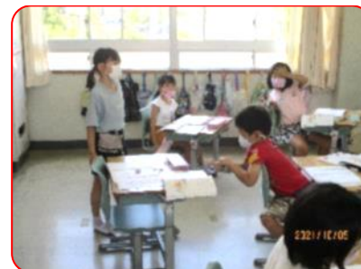
国語科: ゾウさんの気持ちを発表しています。