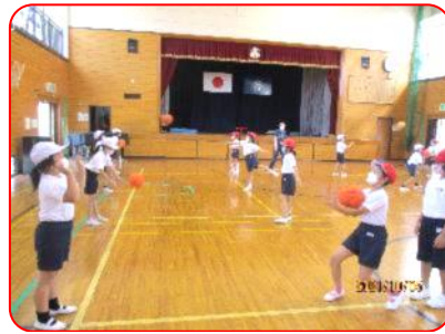
3年生体育科:ポートボール(パス練習)