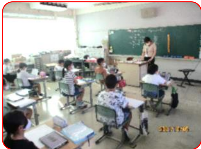
総合:警固屋のやぶについて