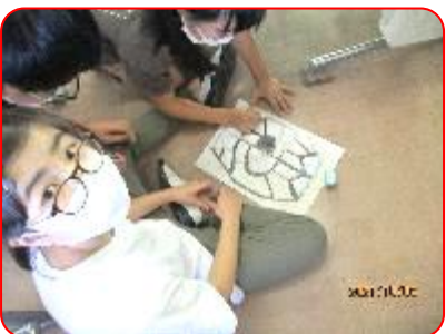
国語科:注文の多い料理店