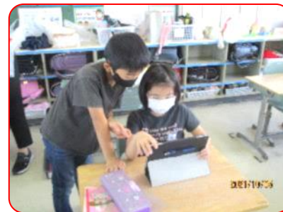
国語科: 友だちの絵を見て話し合っています。