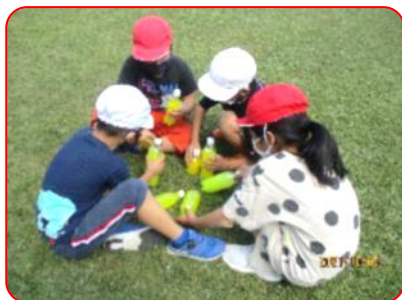
図工科: ペットボトルで模様づくり