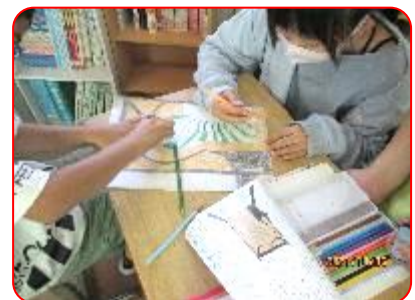
国語科:注文の多い料理店