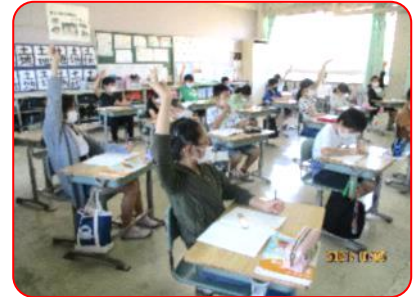
算数科:わかった人? ハイッ!