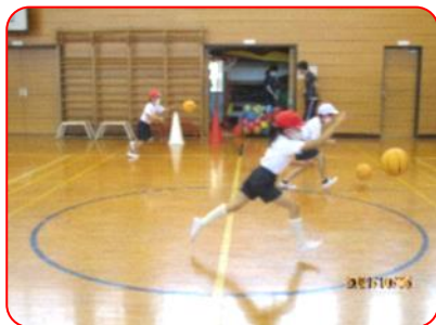
3年生体育科: ポートボール(ドリブル練習)