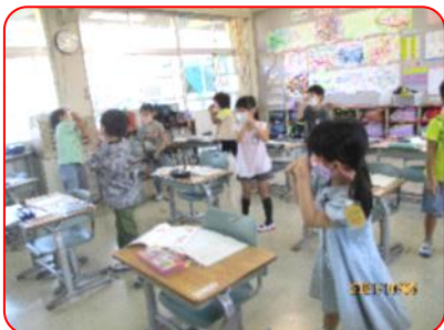
国語科: みんなでゾウさんの動きをしています。