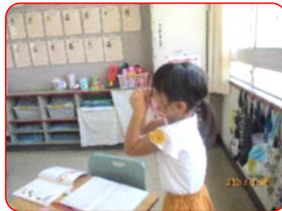
国語科: ゾウさんの動きをしています。