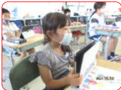
国語科: タブレットで紙芝居を作ります。