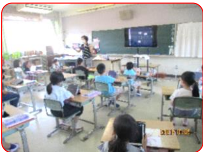
国語科: 絵を見てお話を書こう