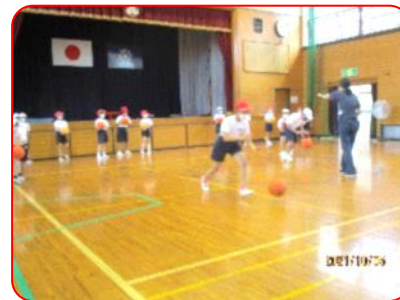
3年生体育科: ポートボール(ドリブル練習)