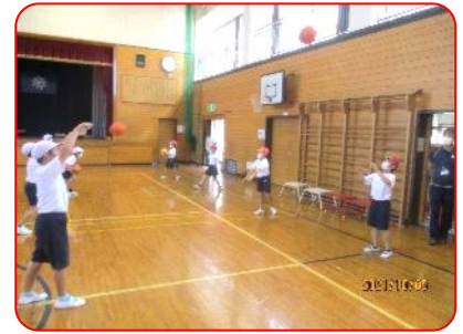
3年生体育科:ポートボール(パス練習)