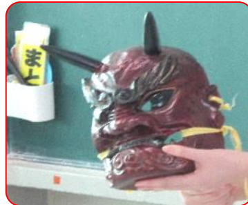
総合:警固屋のやぶについて