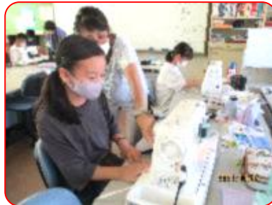
家庭科:エプロン作り(ミシン)