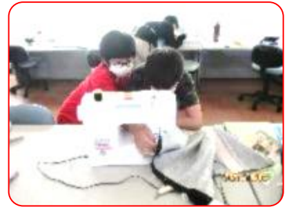
家庭科:エプロン作り(ミシン)